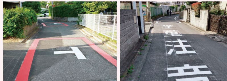
上大久保 埼玉大通りから埼玉大の東側に通じる道